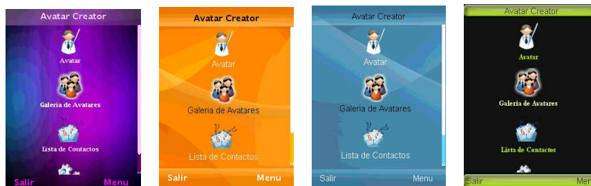
Figura 5: Uso de diferentes temas en la aplicación

La aplicación puede ser personalizada a gusto de cada usuario pudiendo elegir entre diferentes temas visuales. La Figura 5 muestra diferentes personalizaciones de JAvatar Móvil .