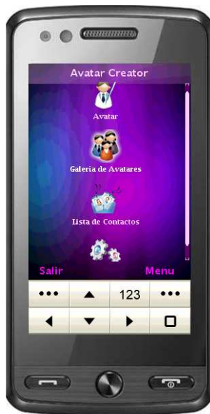
Figura 2: Menú Principal

JAvatar Móvil es una aplicación basada en la especificación MIDP para el entorno JAVA ME, es decir, es un MIDlet que permite crear y compartir avatares entre usuarios de una red IMS utilizando el modelo de comunicación peer-to-peer . La Figura 2 muestra la pantalla inicial de JAvatar Móvil en la que es posible visualizar las diferentes opciones que provee la aplicación.