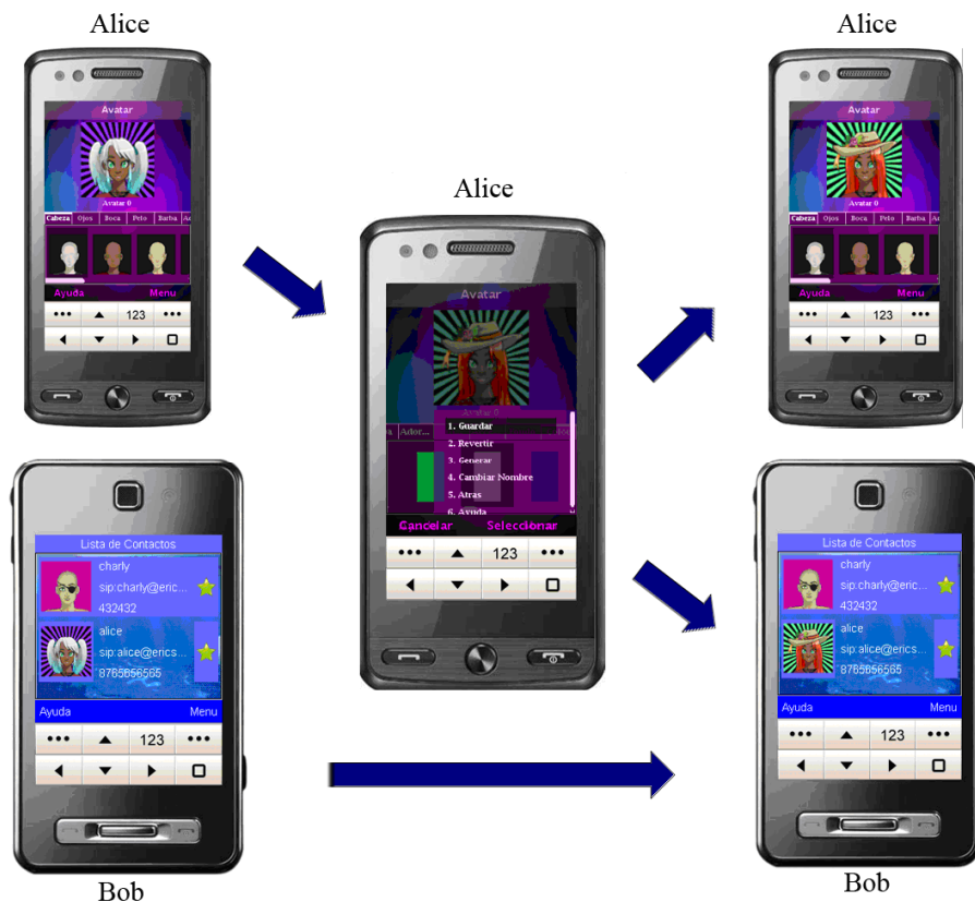
Figura 7: Secuencia de actualizaciones