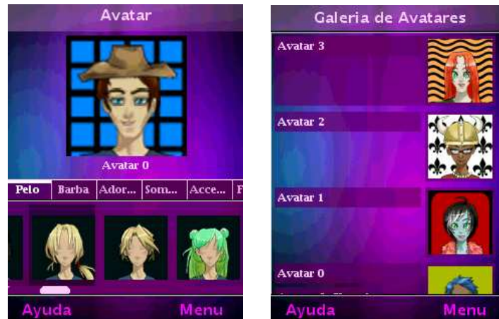
Figura 3: Editor y Galería de Avatares

avatares a una galería para luego seleccionar uno entre ellos como su representante. Todos los avatares en la galería pueden ser editados y / o enviados a otros contactos de la red IMS que estén conectados. Sólo es posible realizar el envío de avatares a quienes estén en la lista de contactos. La Figura 3 muestra la pantalla del editor y la galería de avatares .