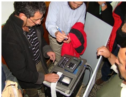
Fig. 3. Presidente de Mesa realizando Escrutinio Provisorio (obsérvese el Acta impresa por la Urna) bajo la mirada de los Fiscales Partidarios