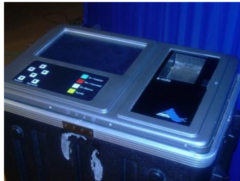
Fig. 1. Urna electrónica

En tres años Altec ha realizado experiencias en campo probando diferentes sistemas electorales, habiendo participado aproximadamente veinte mil electores, corrigiendo errores, mejorando los diseños y ajustando los procedimientos hasta estar en condiciones de efectuar con total y absoluta seguridad, confianza, credibilidad y garantías elecciones diversas en condiciones reales y estando previstas distintas contingencias eventuales.